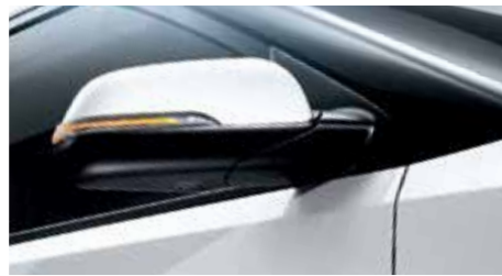
ESPEJOS CON LUCES INTERMITENTES LED