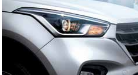
LUCES DE GIRO ESTÁTICAS