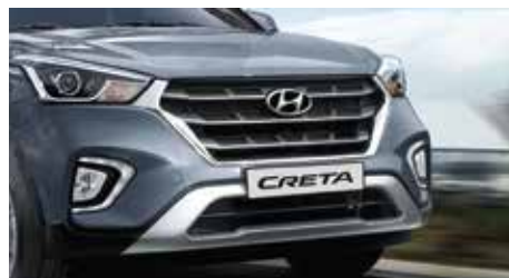
PARRILLA DEL RADIADOR