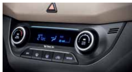
SISTEMA DE CLIMATIZACIÓN ELECTRÓNICA