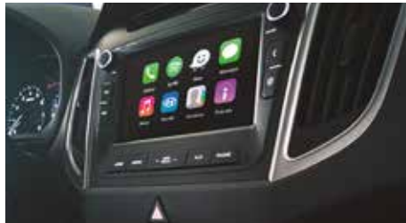
SISTEMA DE ENTRETENIMIENTO HYUNDAI