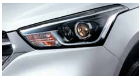
FOCOS DELANTEROS DE PROYECCIÓN