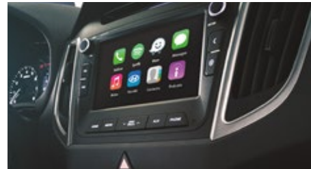
SISTEMA DE ENTRETENIMIENTO HYUNDAI