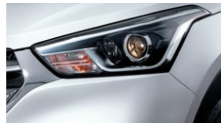
FOCOS DELANTEROS DE PROYECCIÓN