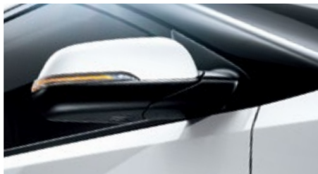
ESPEJOS CON LUCES INTERMITENTES LED