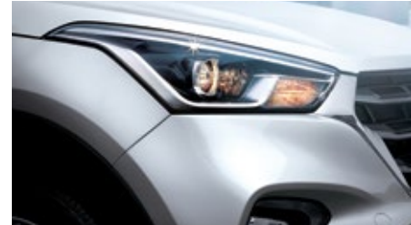
LUCES DE GIRO ESTÁTICAS