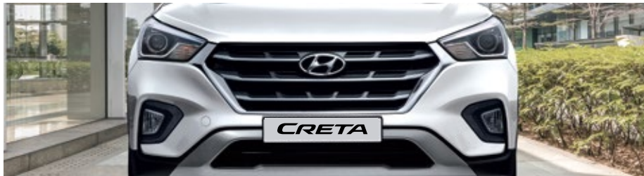
PARILLA Y FRONT REDISEÑADO