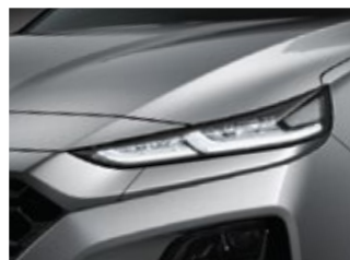
Luces LED de circulación diurna