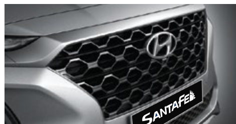
Nuevo diseño exterior

• Es posible que algunos de los equipos descritos o ilustrados en el presente prospecto no se suministren como equipamiento estándar y pueden estar disponibles a un costo adicional.