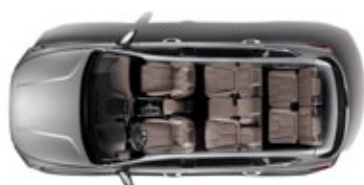
Tres filas de asientos / 7 pasajeros