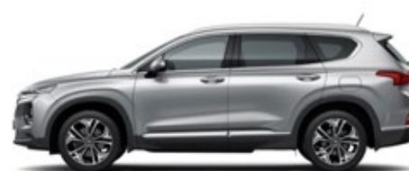
Largo total 4,770 Distancia entre ejes 2,765