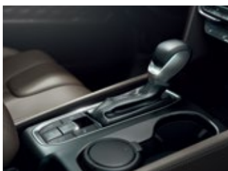
Transmisión automática de 8 velocidades