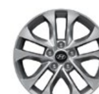
Llantas de aleación de 17"