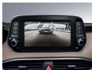
Cámara de retroceso con guía dinámica