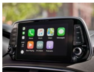
Pantalla Táctil LCD de 7"