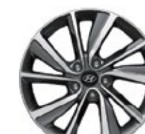
Llantas de aleación de 18"