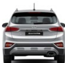
Banda de rodadura* 1,644