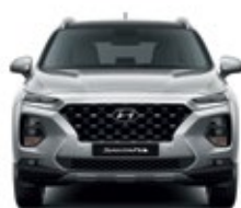
Ancho promedio 1,890 Banda de rodadura* 1,635